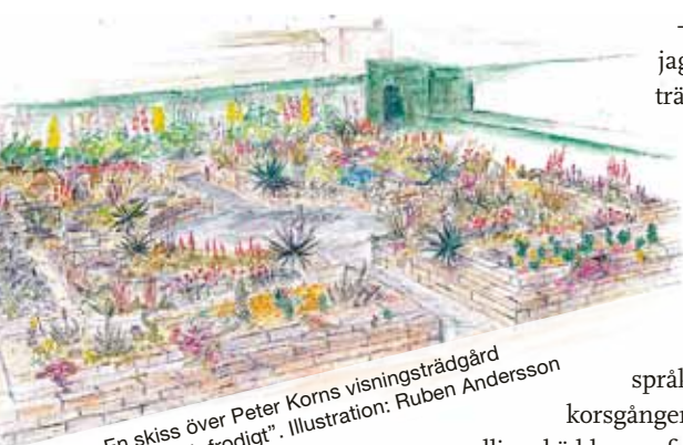
En skiss över Peter Korns visningsträdgård "Torrt och frodigt". Illustration: Ruben Andersson

Efter att i många år ha odlat sin egen trädgård och provat sig fram äger han idag en unik kunskap och odlingserfarenhet som rönar respekt i hela odlingsvärlden.