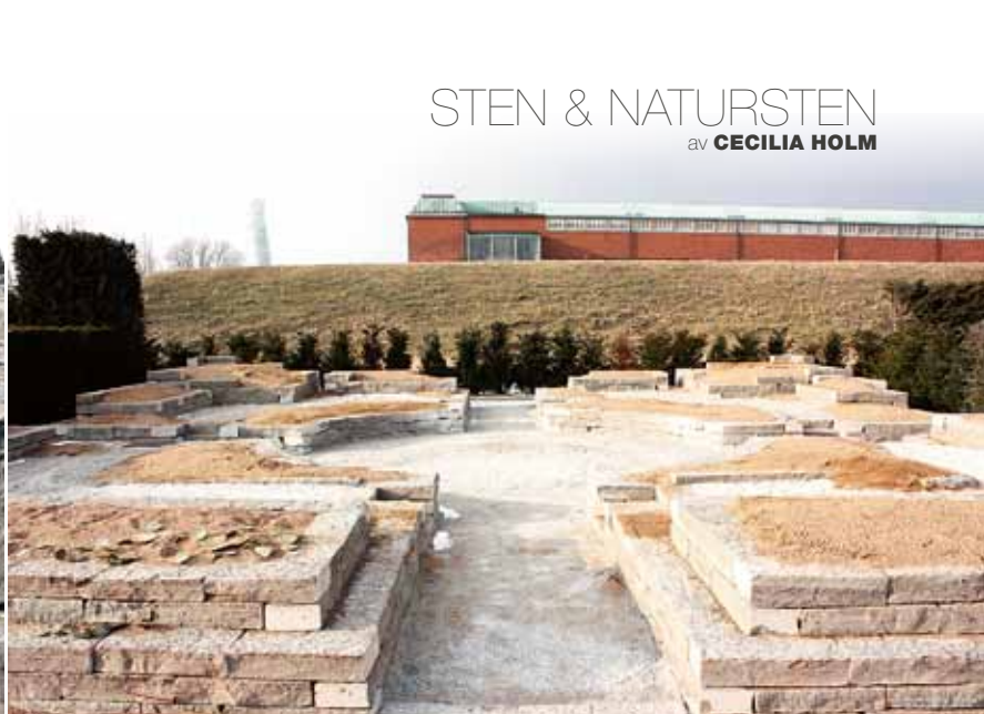
Trädgården färdig för plantering. De sittvänliga murarna värms upp av solen och håller värmen länge.