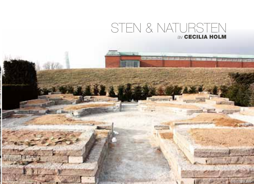
Trädgården färdig för plantering. De sittvänliga murarna värms upp av solen och håller värmen länge.