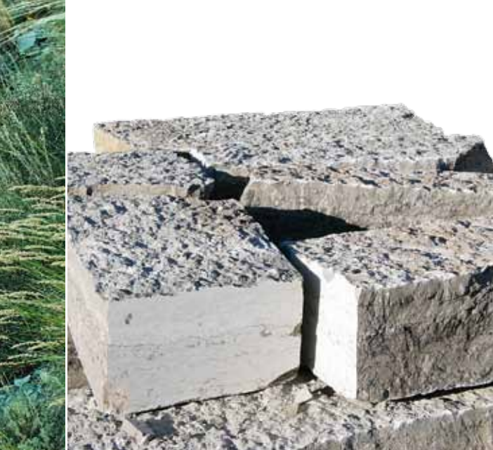
Bäddarna är uppbyggda av grå kalksten från Thorsberg stenhuggeri i Falköping.