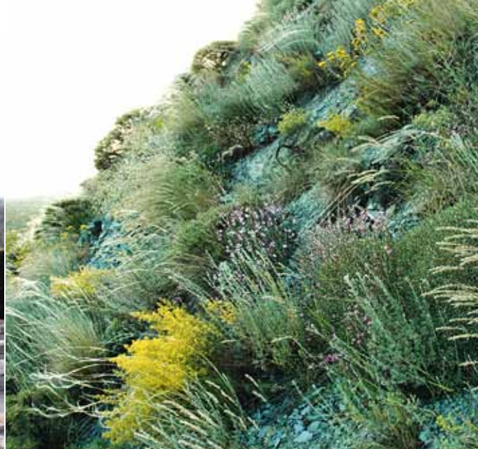
På de böljande kullarna vid kusten av sjön Sevan i Armenien växer örter och gräs i karg miljö.